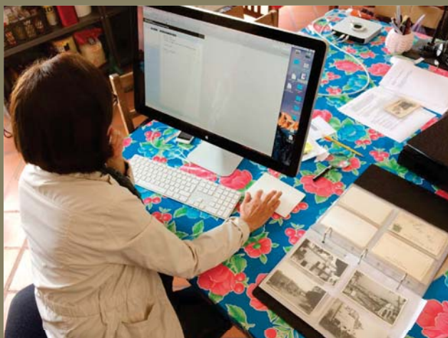
Capturando la información de cada postal en la base de datos