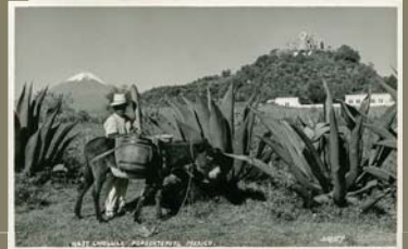
4654 Cholula Popocatepetl Mexico