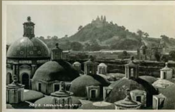
5893 Cholula, Pirámide