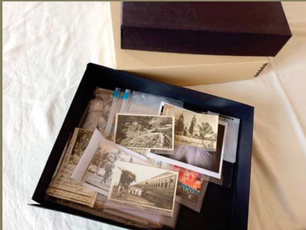
Identificación de las imágenes