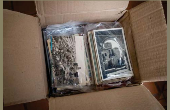
Tarjetas postales guardadas en una caja de zapatos ...

“Para saber hacia dónde vamos hay que saber de dónde venimos”