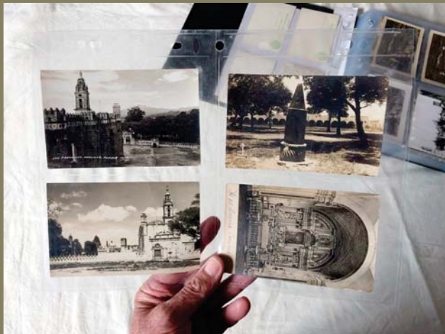
Colocación de las imágenes individuales en hojas de polietileno y estas en carpetas de calidad archivo.

La clave topográfica que permite ubicar físicamente cada pieza en el archivo es una clave alfanumérica: FHA1.C1.CH; donde FH se refiere a Fondo Histórico, A1 al número de anaque, C1 al número de carpeta, y CH a Cholula, en este caso.