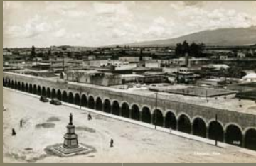
7548 Cholula, Pue.