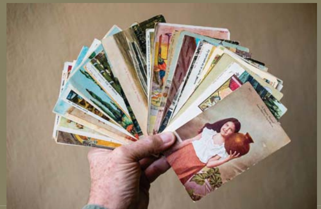
Hay que establecer orden dentro del caso ...