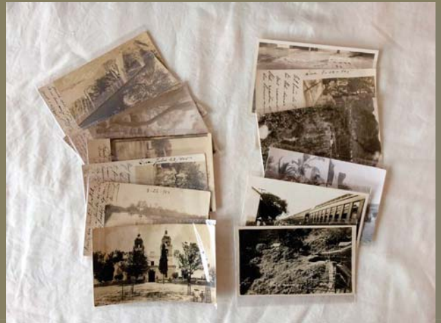
Organización por región y/o ciudad ... según las metas de cada quien.