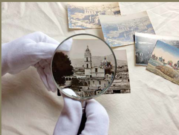
Inspección visual de cada imagen para determinar su estado de conservación.