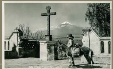
4656 Cholula Popocatepetl Mexico