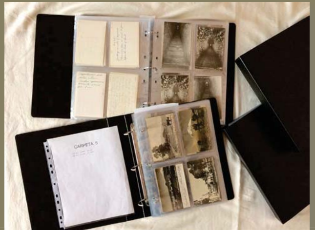
Carpetas de calidad de archivo (Printfile).