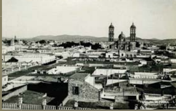
Panorama de Puebla - 1., autor desconocido, c. 1930.