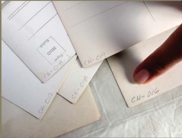
Asignación de un número de registro. Anotándolo al reverso con un lápiz suave.