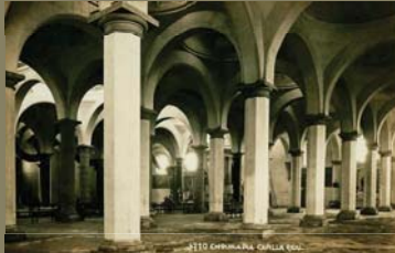
3770 Cholula Pta. Capilla Real