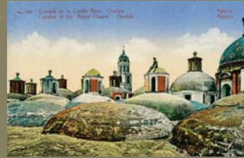
No. 184 Latapi & Bert Cúpulas de la Capilla Real, Cholula.