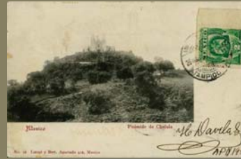
No. 26 Latapi y Bert. Pirámide de Cholula, ca. 1906.