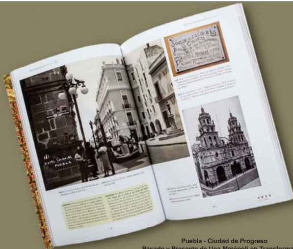
Puebla - Ciudad de Progreso Pasado y Presente de Una Metrópoli en Transformación H. Ayuntamiento de Puebla, Gerencia del Centro Histórico Y Patrimonio Cultural, 2015